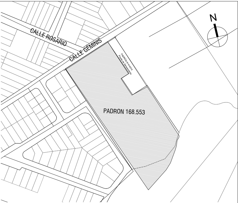
PLANO DE UBICACIÓN escala 1/4000